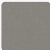
F 433 ST10 Лен Антрацит Повърхностна структура Deepskin Rough